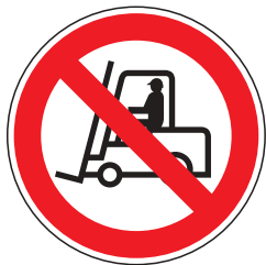
P007 Für Flurförderzeuge verboten