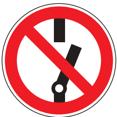
P010 Nicht schalten