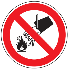
P004 Mit Wasser löschen verboten