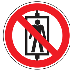
P013 Personenbeförderung (Seilfahrt) verboten