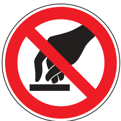
P008 Berühren verboten