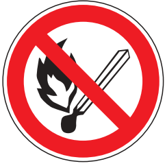
P002 Feuer, offenes Licht und Rauchen verboten