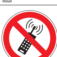
P018 Mobilfunk verboten