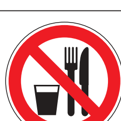
P019 Essen und Trinken verboten