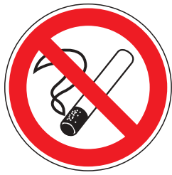
P001 Rauchen verboten