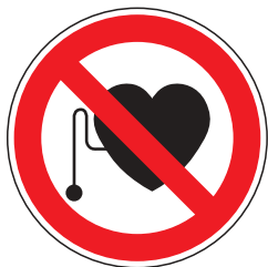
P011 Verbot für Personen mit Herzschrittmacher