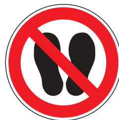
P015 Betreten der Fläche verboten