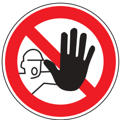
P006 Zutritt für Unbefugte verboten