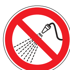
P017 Mit Wasser spritzen verboten