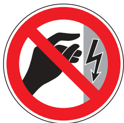
P009 Nicht berühren, Gehäuse unter Spannung