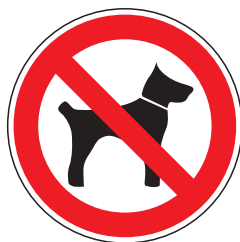
P014 Mitführen von Tieren verboten