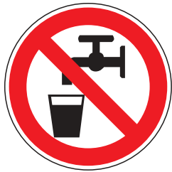
P005 Kein Trinkwasser