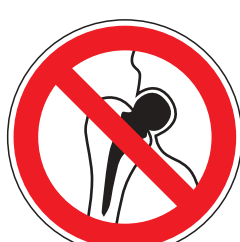
P016 Verbot für Personen mit Implantaten aus Metall