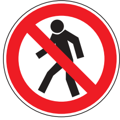
P003 Für Fußgänger verboten