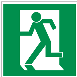
Kombination aus Richtungsangabe (E001) und Rettungsweg/Notausgang (E009)