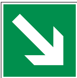
Kombination aus Richtungsangabe (E010) und Rettungsweg/Notausgang (E002)