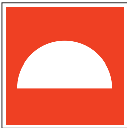
F007 Mittel und Geräte zur Brandbekämpfung